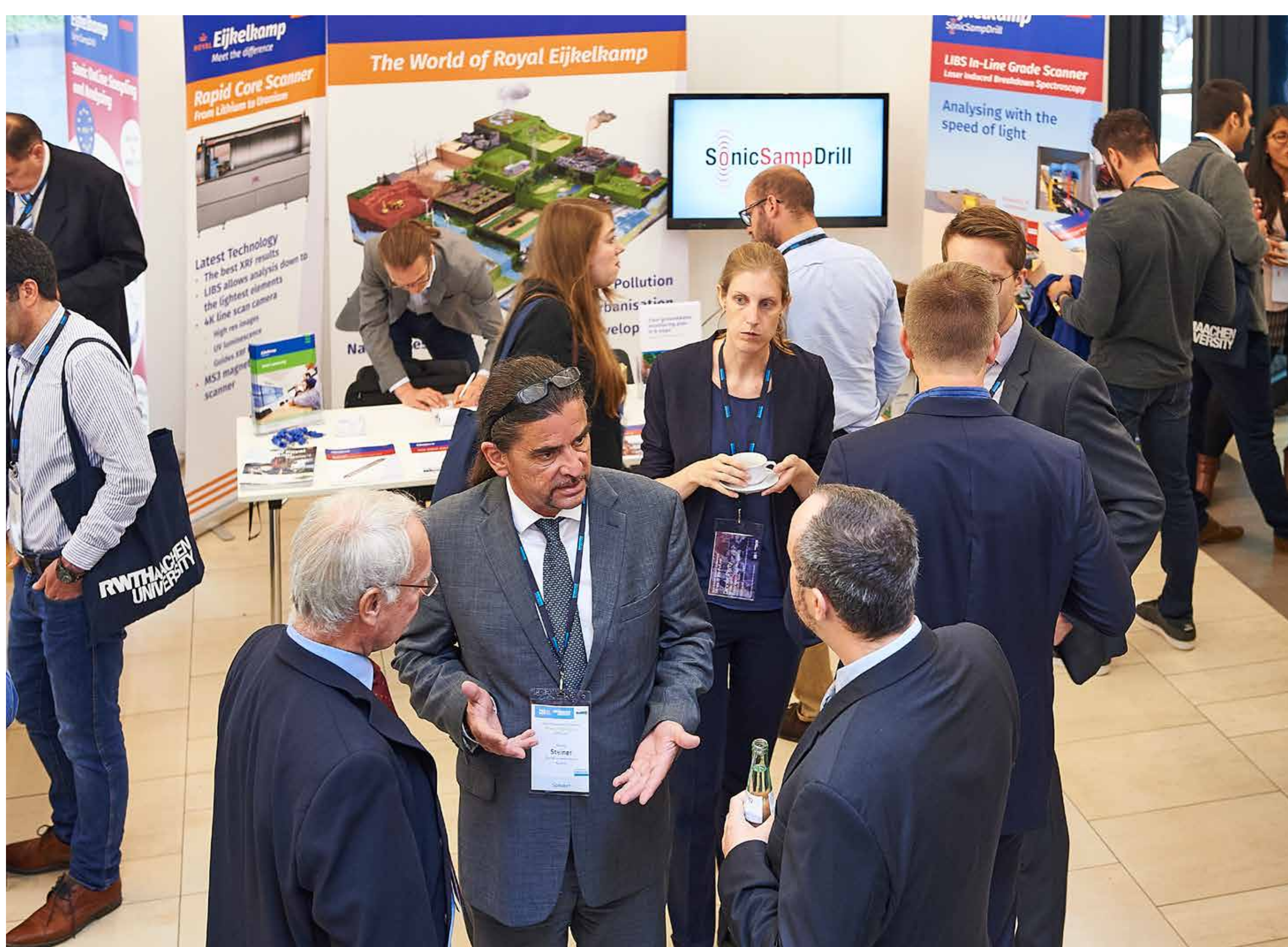
Networking in the industrial and academic exhibition Erfahrungsaustausch im Rahmen der Industrieausstellung